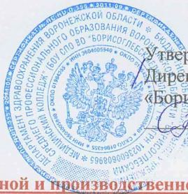
График прохождения учебной и производственной практик по специальности 33.02.01 «Фармация» на 2015 – 2016 уч. г.